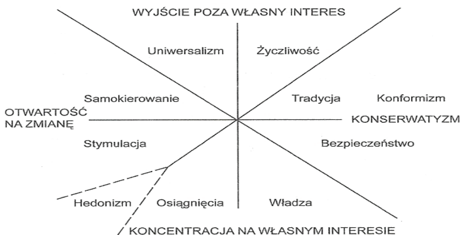
Rysunek 2. Uniwersalne typy wartości wg Shaloma Schwartza 12

Interesujące są badania nad wartościami prowadzone w kontekście psychologii społecznej w środowisku międzykulturowym, a wiodące do sformułowania najważniejszych, kulturowo uniwersalnych typów wartości i ich wzajemnego położenia w przestrzeni dwuwymiarowej, autorstwa Shaloma Schwartza: