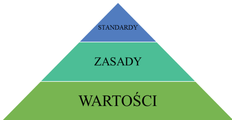
Rysunek 3. Zależność standardów, zasad i wartości (opracowanie własne)

Współzależność wartości, zasad i standardów można przedstawić tak, jak na rysunku 3.